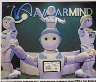
Тапшира робота запомнил посетителя выставки CES в Лас-Вегасе.

В зависимости от того, в каком состоянии пребывает человек, робот может изобразить на своем «лице» улыбку, грусть, удивление и другие эмоции. В Honda отмечают, что робот сделан из мягкого