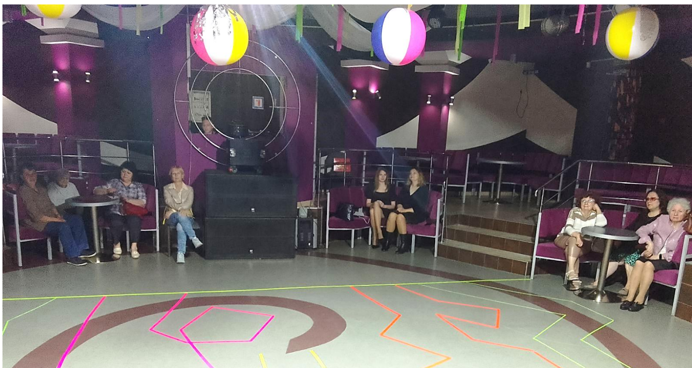
Эпизоды творческого вечера писателя