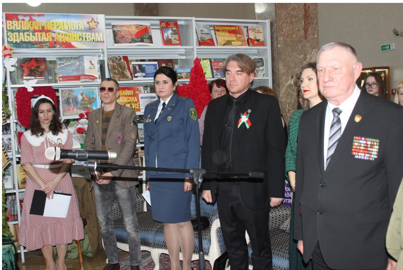
Памяти павших в годы Великой Отечественной войны. Минута молчания