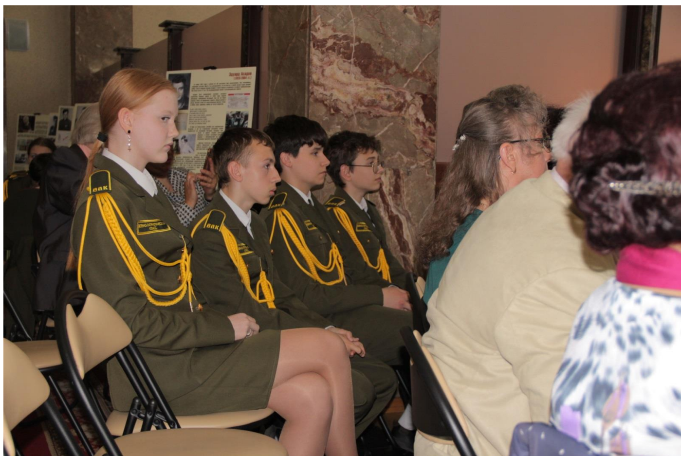
и его группа поддержки