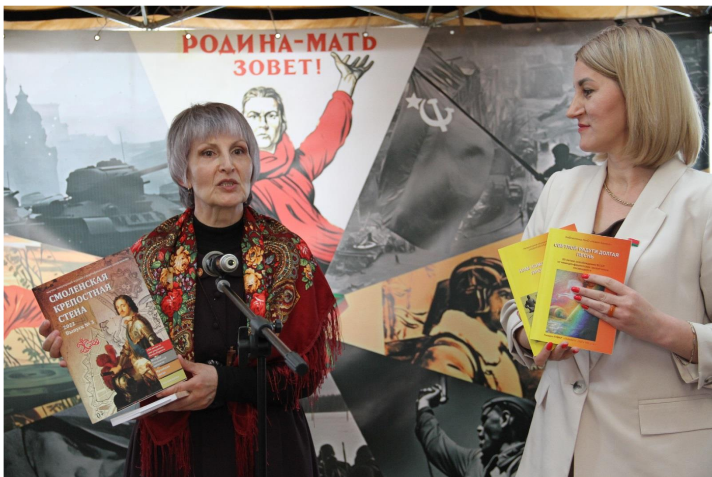
и её литературные подарки Гродненской областной библиотеке