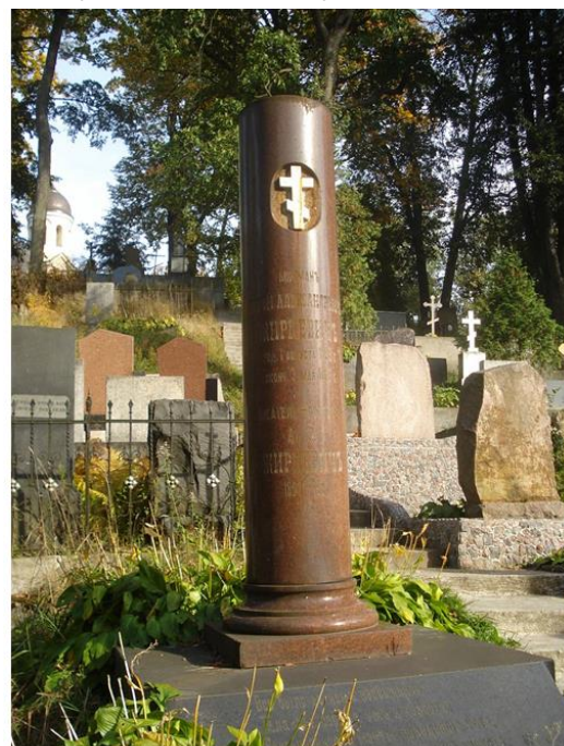
Надгробный памятник А. В. Жиркевичу на Евфросиниевском кладбище

жизни. Вильно: Русский почин, 1909, Сонное царство великих начинаний (К столетнему юбилею дня рождения Ивана Петровича Корнилова). Вильно: Русский почин, 1911. Пасынки военной службы (Материалы к истории мест заключения военного ведомства