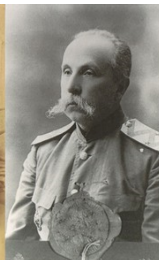
А.В. Жиркевич в конце жизни