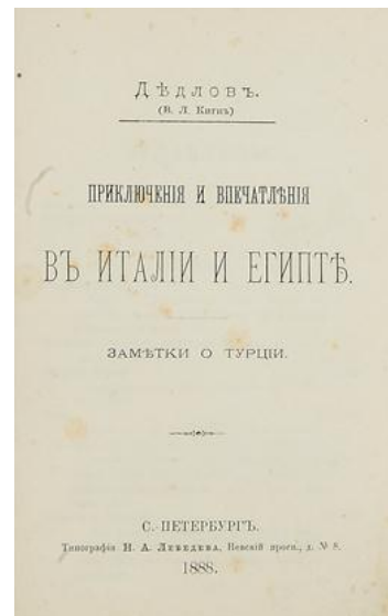
Вид некоторых книг В.Л. Дедлова-Кигна