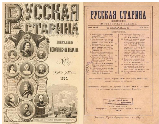
Журнал «Русская старина». Вторая половина XIX в.

Современные поклонники мемуаристики читают «Записки» И.С. Жиркевича с огромным интересом и большой пользой, видя в нем достойного гражданина своего Отечества и добрый пример для подражания.