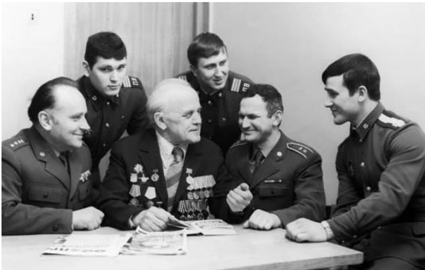
На фото: А. А. Овечкин в центре