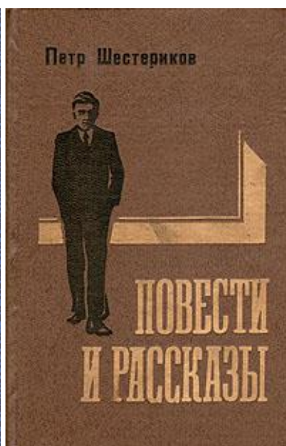
Обложки некоторых книг Петра Шестерикова