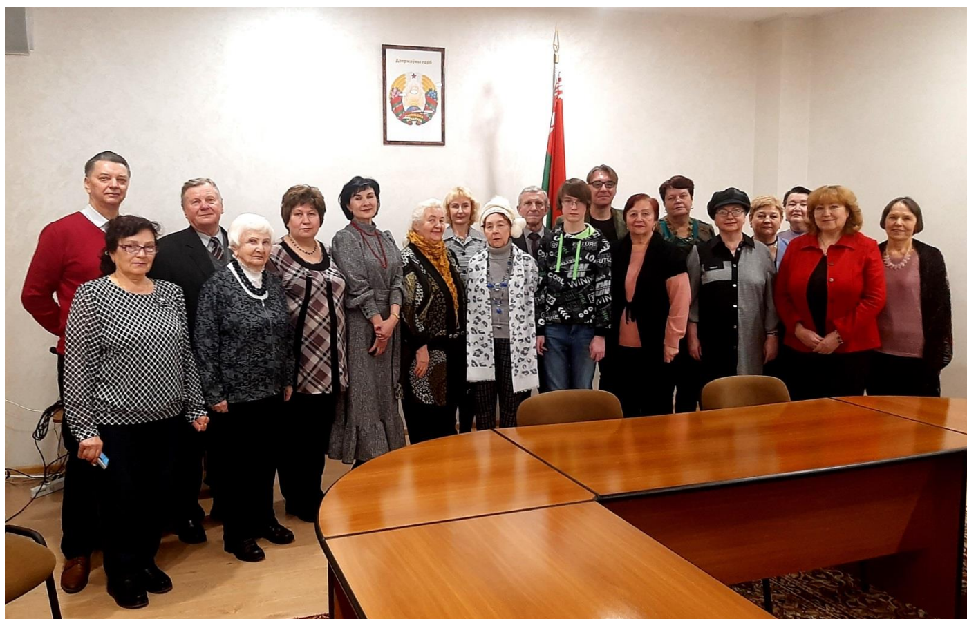
Словодром # 44