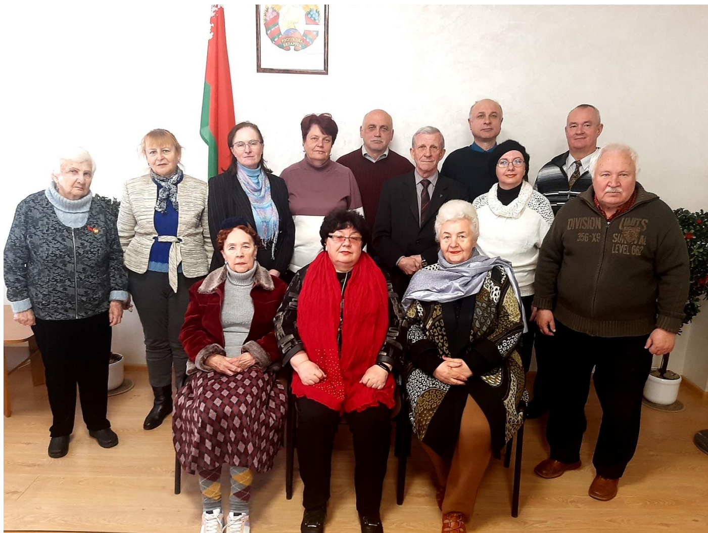
Апрель ' 23. Словодром # 48