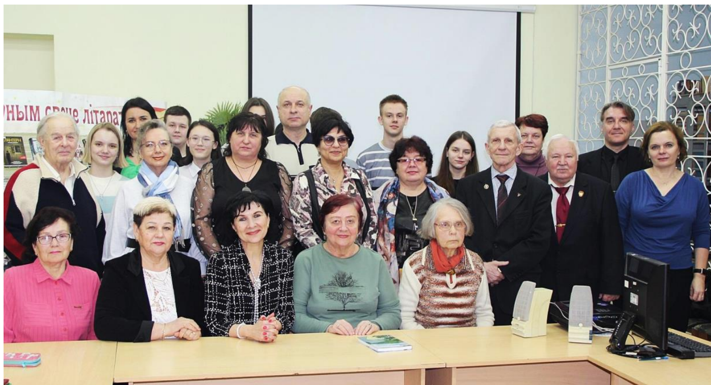
Февраль, вистреча #55, тема «Дала мне маці гэту мову»