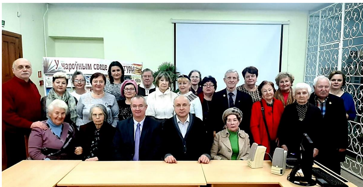
Январь, встреча #54, тема «А что люди скажут?»