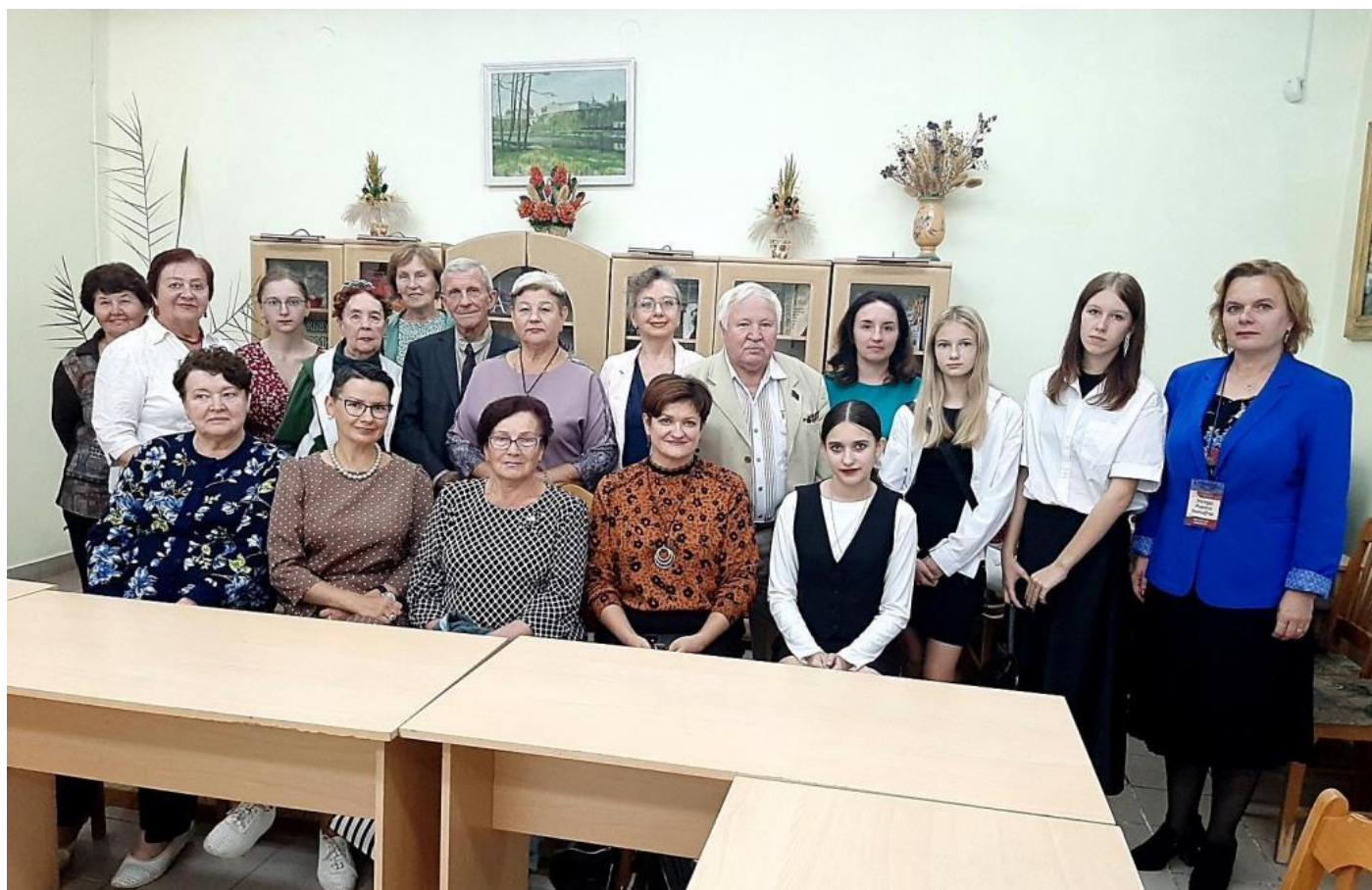
Сентябрь, встреча #59, тема «Пророки в своём отечестве»