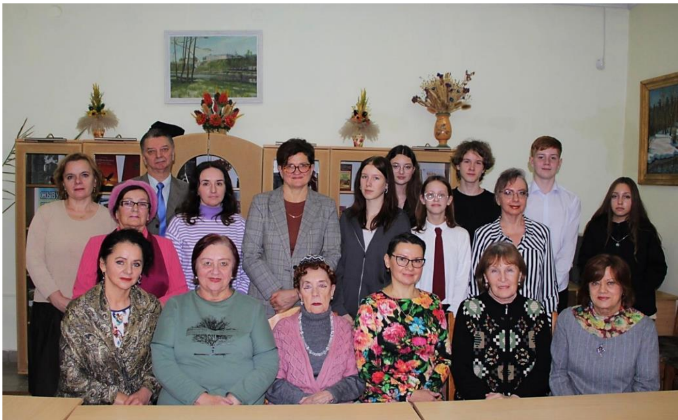
Ноябрь, встреча #61, тема «Классовое сознание»

Дорогие мои, я выкладываю эти фото далеко не с целью всеобщего любования. Вовсе нет. Всё это исторические документы. Для меня чрезвычайно важно не только то, кто на них изображён. Не менее важно и то, кого на них нет. Многие ключевые участники дискуссий пожелали остаться за кадром, перед этим направив ход беседы именно по своему сценарию. Именно их выводы были признаны клубом наиболее убедительными (именно убедительными, аргументированными, обоснованными, а не правильными, ибо что такое сегодня правда!). Их воле подчинился (или чуть было не подчинился) клуб. Например, на фото участников дискуссии на тему «Внимание: вредные книги!» нет человека, который как ни странно сумел убедить всех в полезности для нашего общества похабных, аморальных книг. На фото участников дискуссии на тему «Внимание: добрые книги!» нет тех, кто устроил из общения сплошной демарш и чуть было не заставил меня по старинке выдернуть из брюк ремень... Сегодня я размышляю над тем, почему такие фактически главные люди каждого мероприятия отказываются попадать в кадр вместе со всеми, с теми, кого им удалось привлечь на свою сторону, подчинить своим жизненным убеждениям. Тенденция однако... Очень похоже на спешную эвакуацию по классическому принципу: «Мавр сделал своё дело – мавр может уходить».