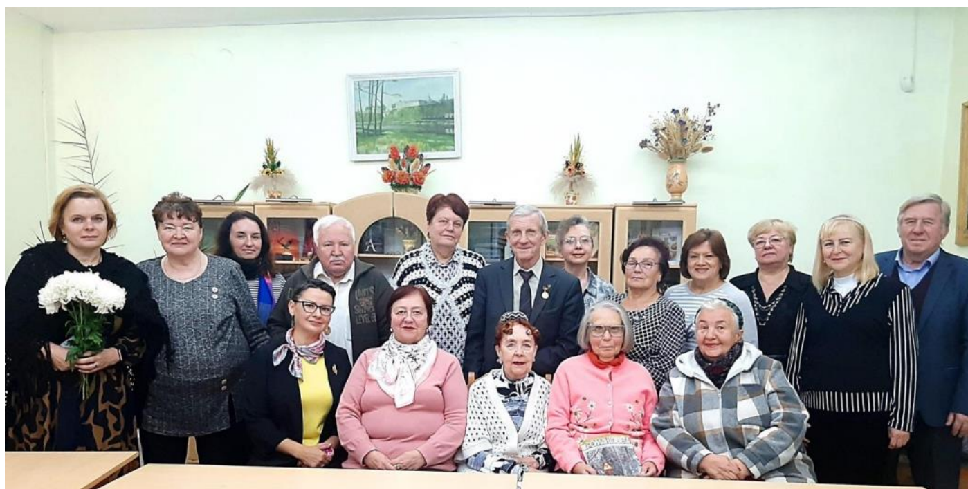
Октябрь, юбилейная 60-я встреча, тема «Место под солнцем»