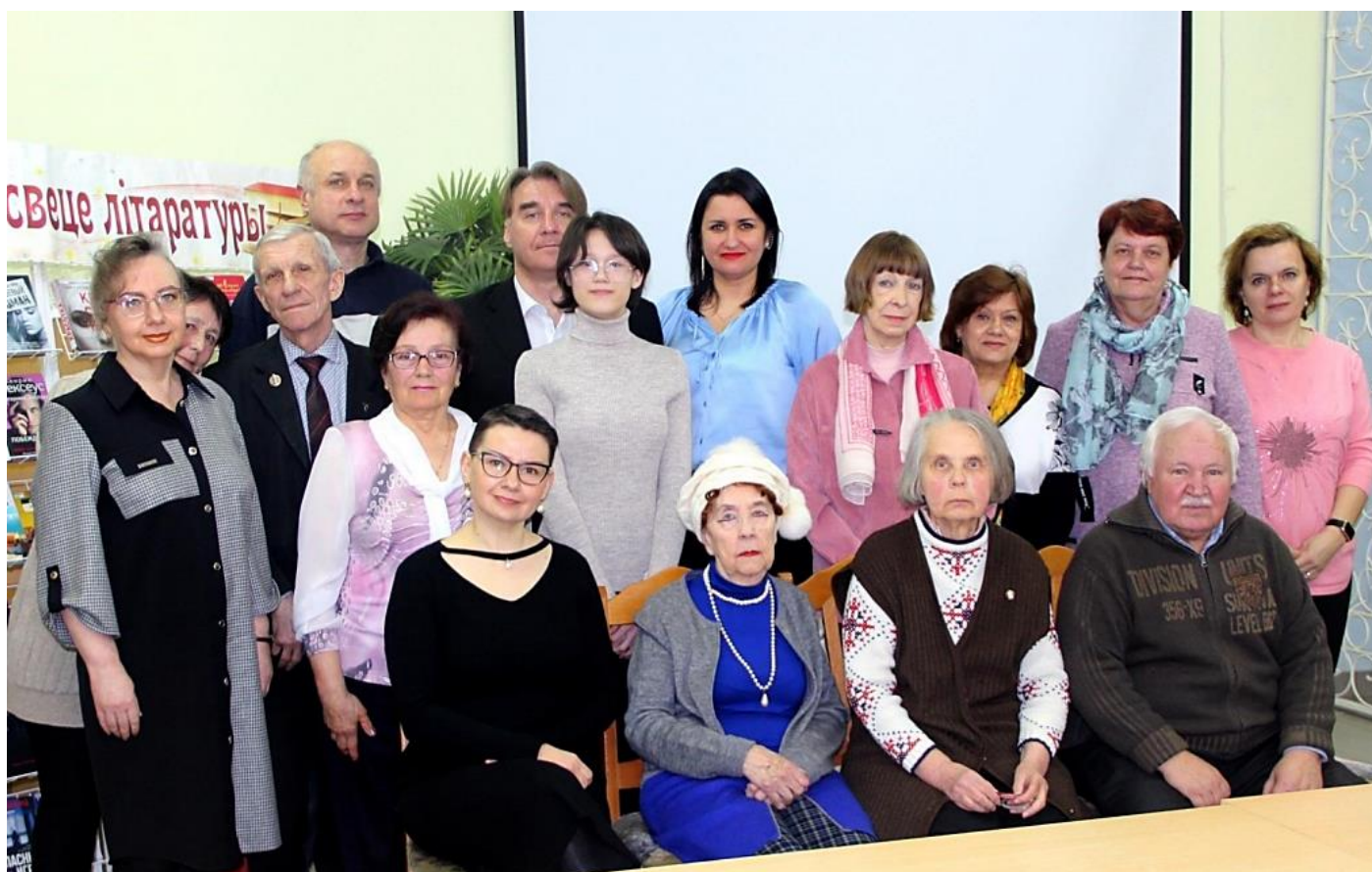
Март, вистреча #56, тема «Професіі і професіяналы»