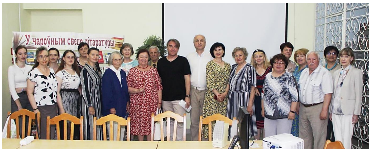
Май, вистрача #58, тема «Внимание: добрые книги!»