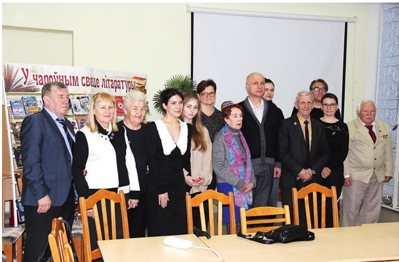
Апрель, вистрача #57, тема «Внимание: вредные книги!»