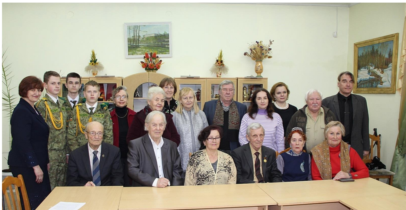
СЛОВОДРОМ # 65