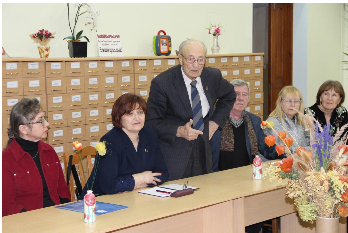
Символические углы круга заостряются