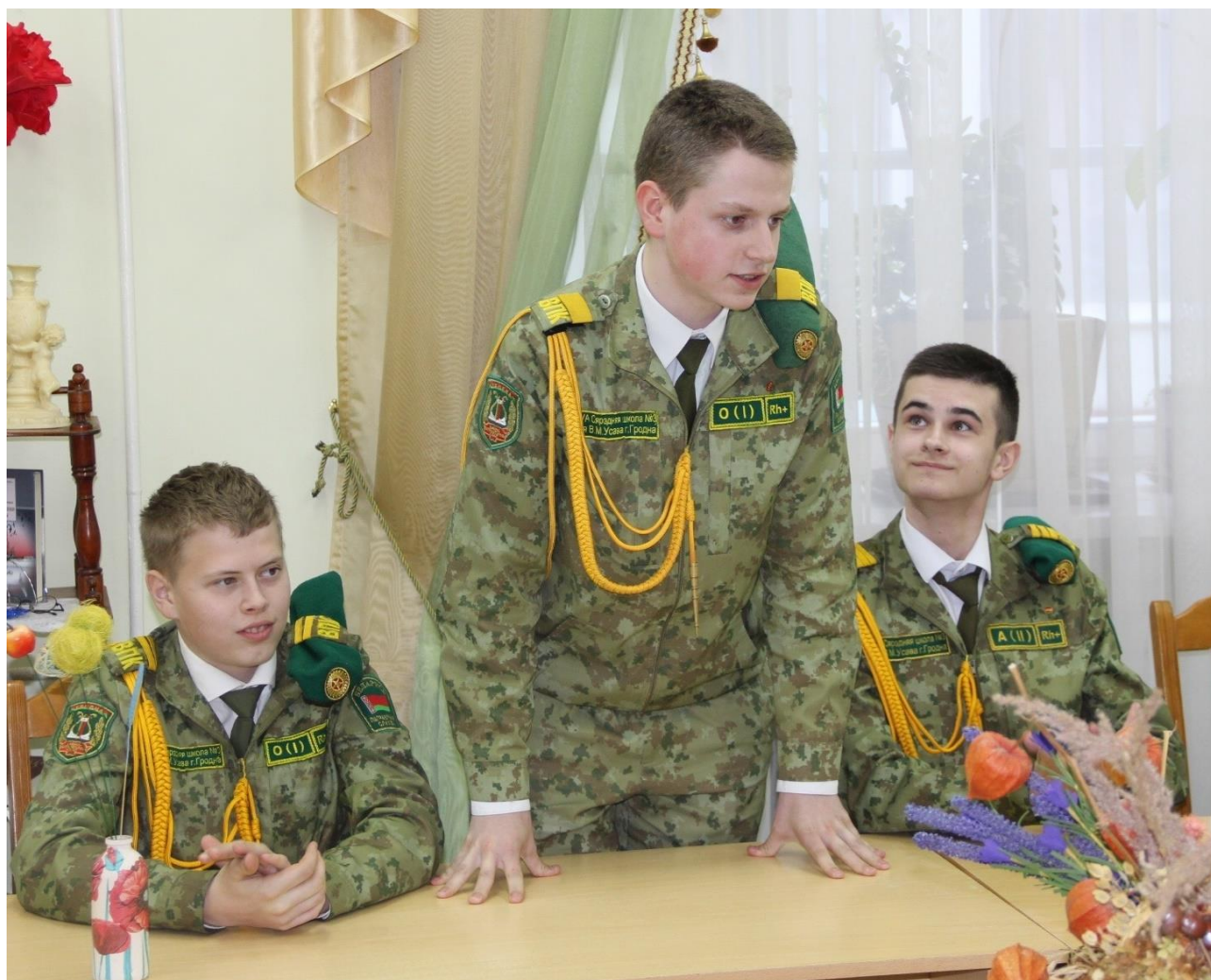
Внимание: говорит наше завтра