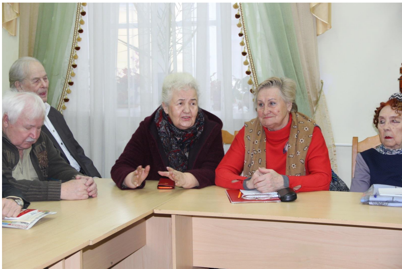
Дискуссия набирает обороты