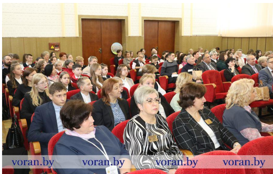
Воранаўскі райвыканкам. Падчас урачыстага адкрыцця форума