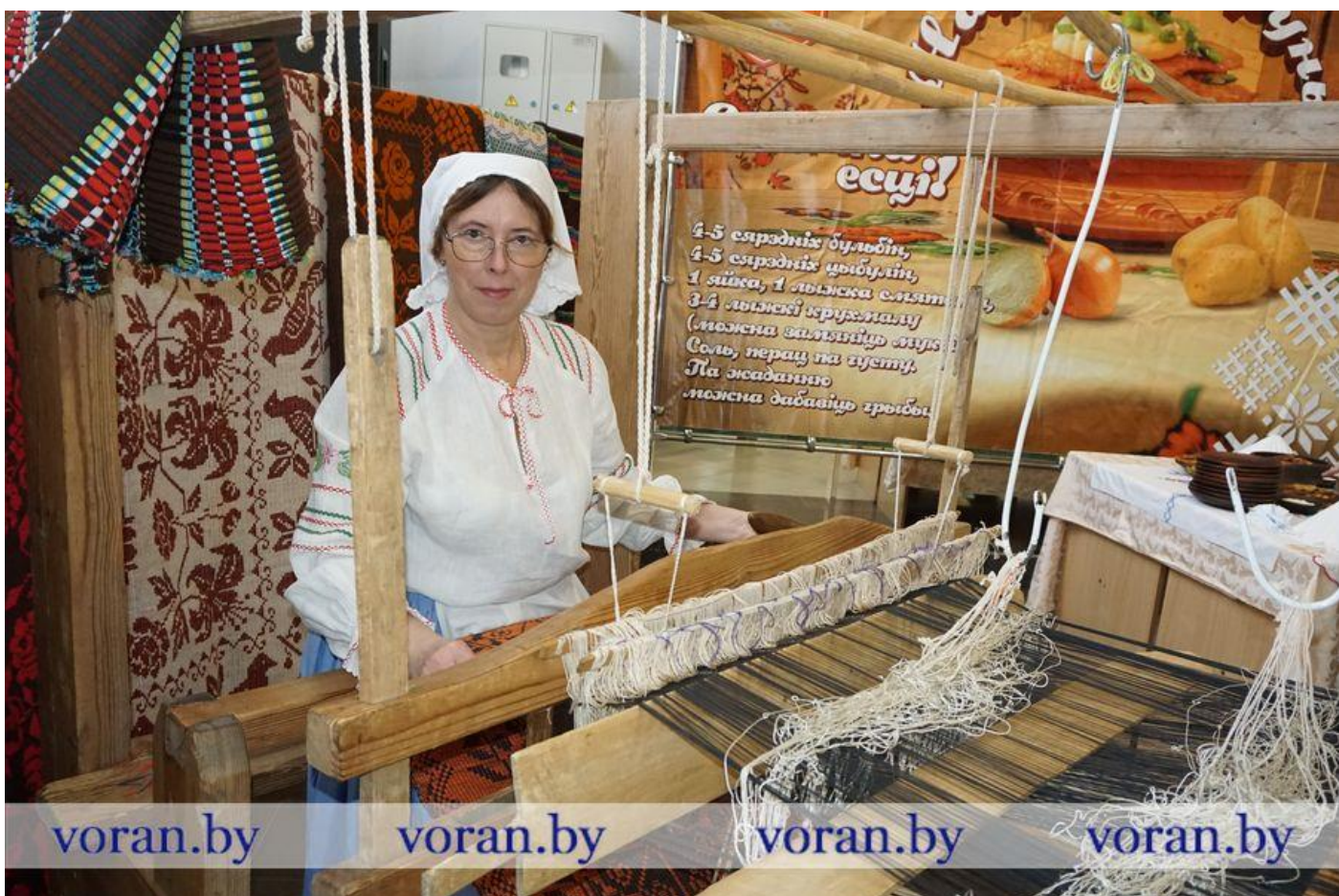
Воранаўскі раённы дом культуры. Фінальная частка мерапрыемства сустрэла каларытнай выставай вырабаў народных майстроў і праектаў бібліятэк раёна