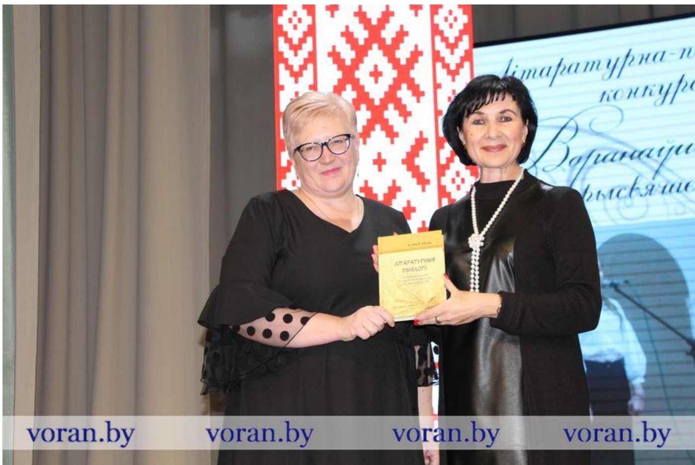
Якое свята без падарункаў!