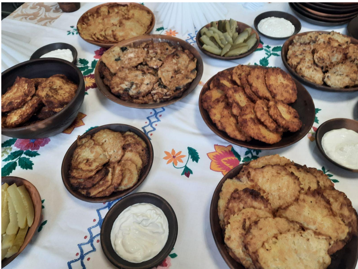
Традыцыйныя беларускія дзеруны