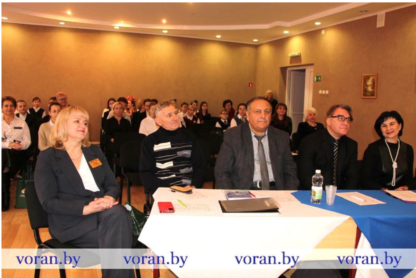
Аграгарадок Канвелішкі. Падчас раённага паэтычнага конкурсу «Воранаўшчыне прысвячаецца»