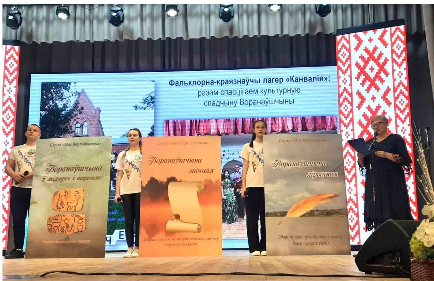
Прэзентацыя кніжнай серыі «Мая Воранаўшчына»

Сапраўднае захапленне ва ўсіх без выключэння гасцей «Воранаўскіх чытанняў» выклікалі шчырасць і сардэчная цеплыня мясцовых жыхароў, павага і ўвага з боку раённых уладаў. Воранаўскі край здаўна славіцца багаццем сваіх народных традыцый, гісторыі і культуры, якія тут ведаюць, шануюць і пастаянна даследуюць. Беларуская мова гучыць не толькі ва ўстановах адукацыі, але і на вуліцах. Кожны, хто аказваецца на Воранаўшчыне, адчувае поўны чалавечай дабрыні, непаўторны дух гэтага краю, атрымлівае порцыю душэўнага цяпла ад яго жыхароў. Гэта не можа не натхняць на творчасць і навуковыя даследаванні, на мірную стваральную працу! Гасціннасць, шчырасць, спагада беларусаў сустракаюць вас па ўсёй краіне. Тым не менш, на падмурку з такой гуманістычнай філасофіі Воранаўскі раён Гродзенскай вобласці робіць сур'ёзную заяўку на лідэрства ў справе развіцця традыцый літаратуры і краязнаўства. З гэтай нагоды актыўнае і эфектыўнае супрацоўніцтва раёна з Купалаўскім універсітэтам выглядае заканамерным. Прыемна, што ў бягучым 2023 годзе нашымі калегамі па пісьменніцкай арганізацыі, навукоўцамі-філолагамі па ініцыятыве і пры падтрымцы раённых уладаў створана і выпушчана кніжная трылогія «Мая Воранаўшчына» з трох кніг: «Воранаўшчына лірычная. Зборнік вершаў педагогаў і вучняў Воранаўскага раёна»; «Воранаўшчына эпічная. Зборнік празаічных твораў педагогаў і вучняў Воранаўскага раёна» і «Воранаўшчына ў легендах і паданнях». Зборнік фальклорных твораў» (укладальнікі Р. К. Казлоўскі і А. Э. Сабуць).