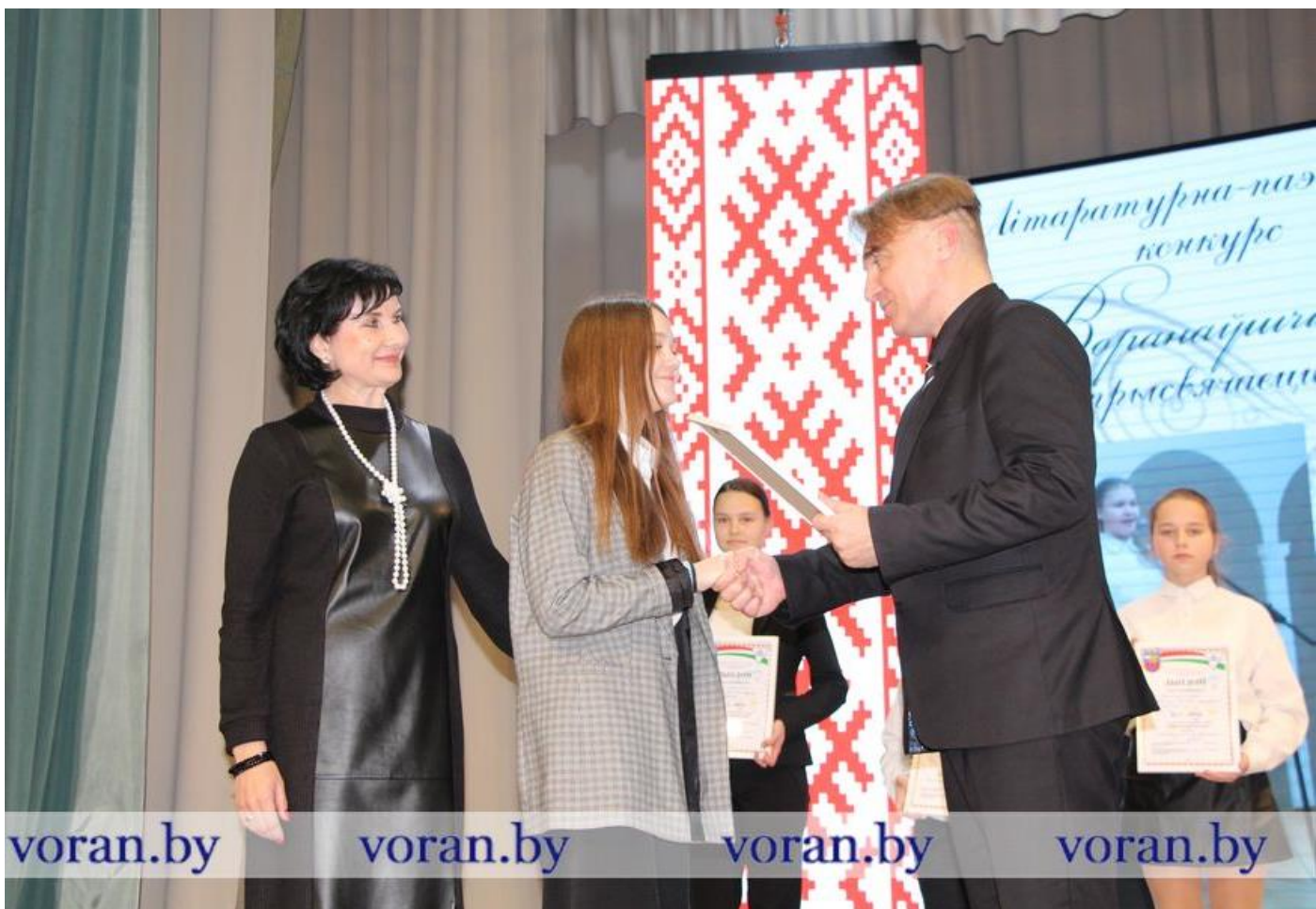
Заслужаныя ўзнагароды – юным паэтам