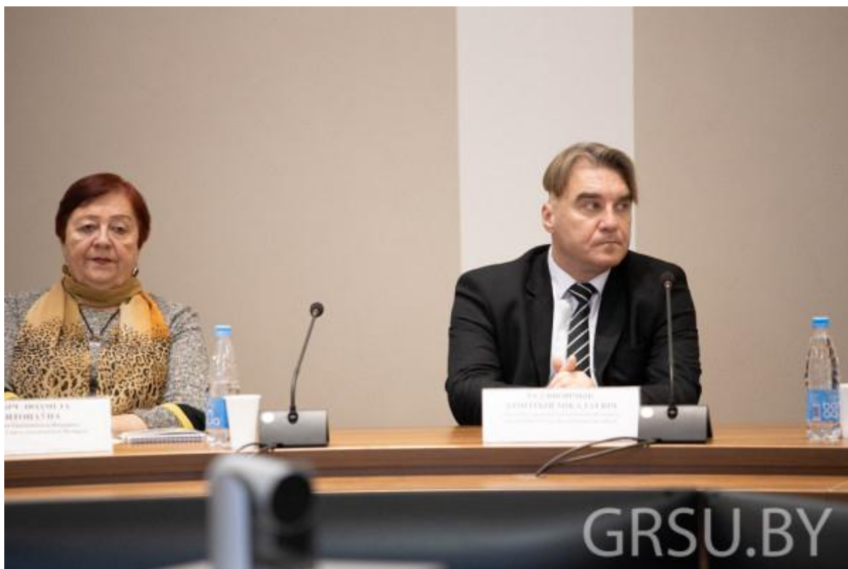
Сярод удзельнікаў навуковага форуму – прадстаўнікі Саюза пісьменнікаў Беларусі