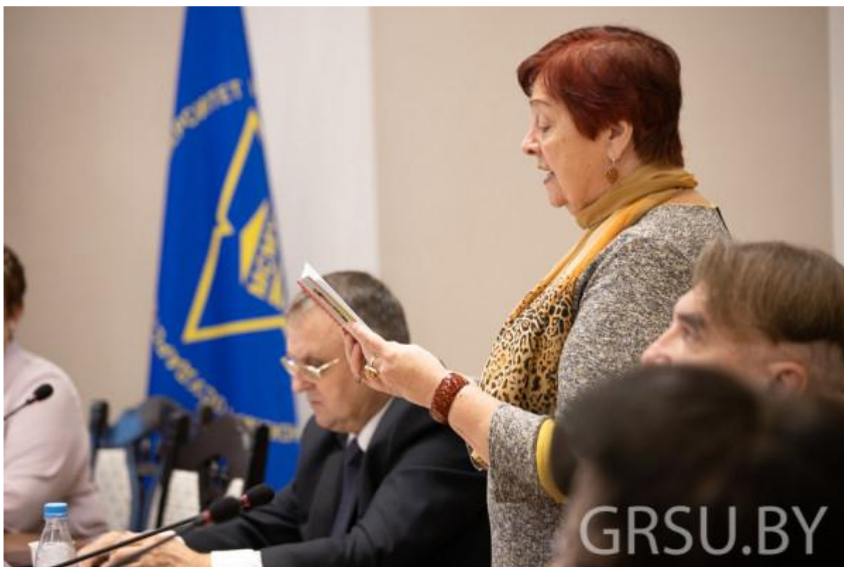
У гонар Янкі Купалы – аўтарскі верш ад Людмілы Кебіч