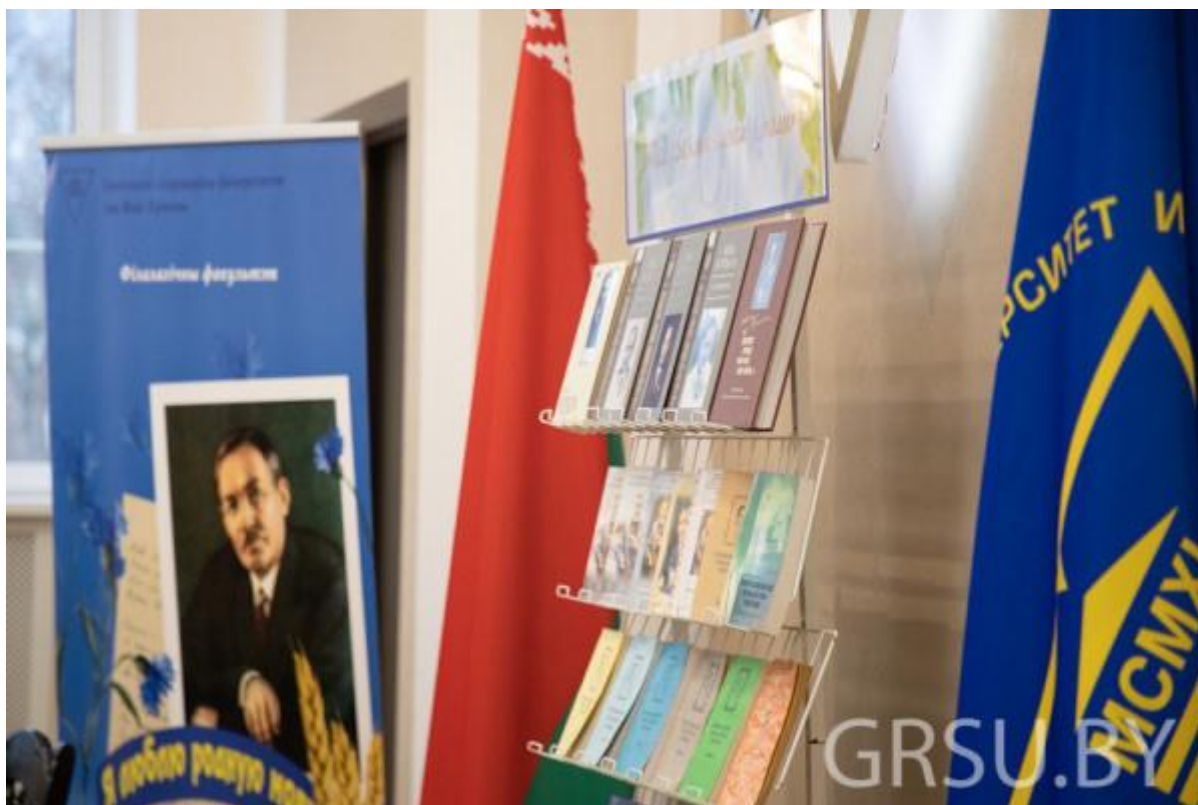
Бібліятэка Купалаўскіх чытанняў