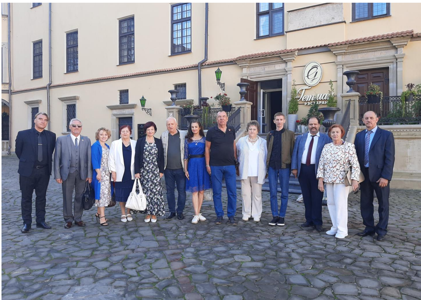
Перад пачаткам фестывалю з калегамі з розных рэгіёнаў Беларусі