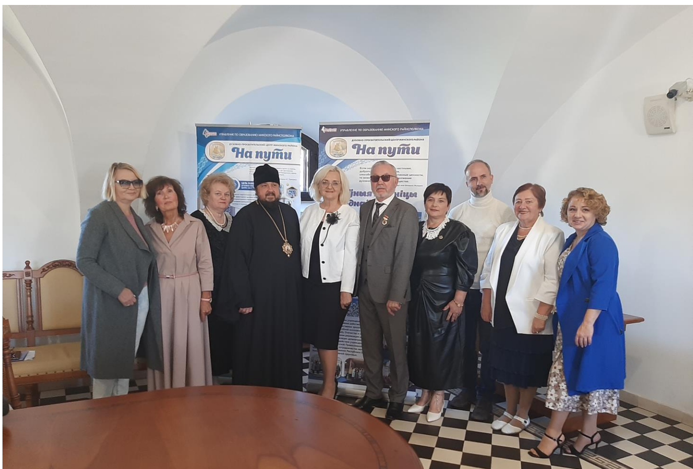
Удзельнікі круглага стала