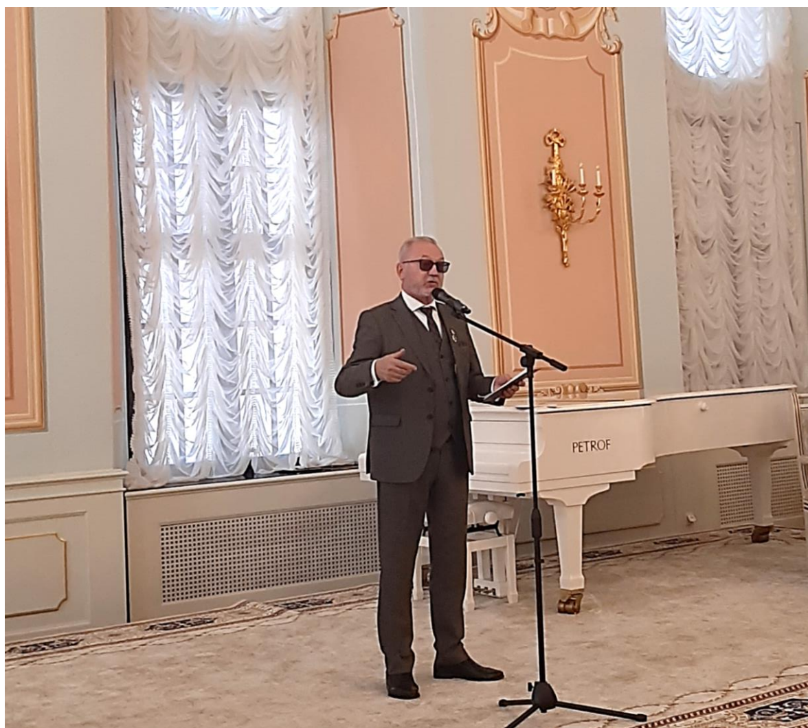
Кіраўнік сталічнай дэлегацыі, паэт Міхась Пазнякоў