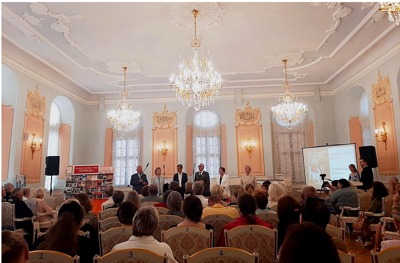
Падчас урачыстага адкрыцця фестывалю