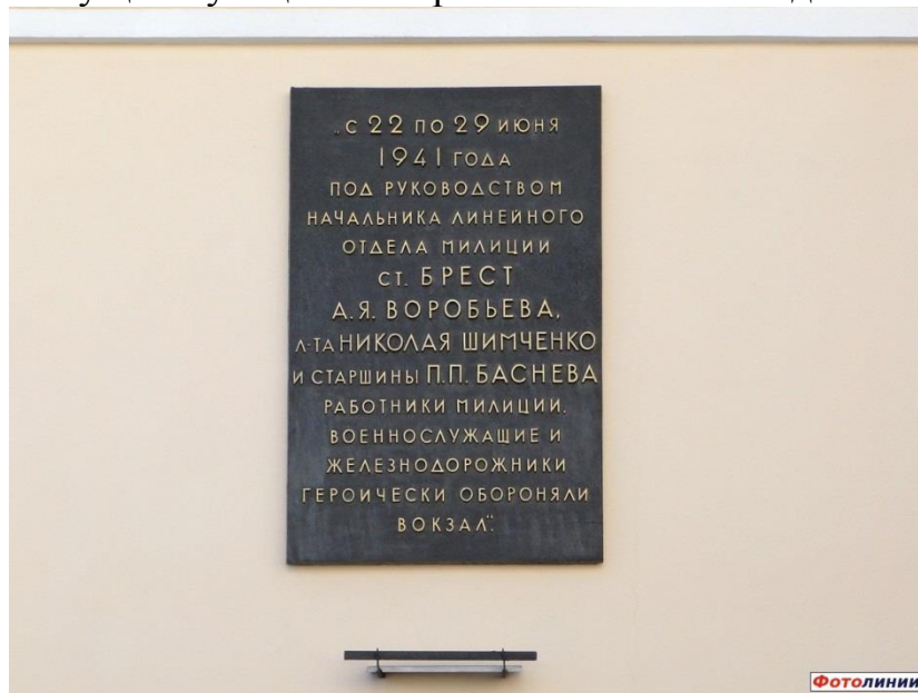
Памятная плита на стене брестского ж/д вокзала

Всё вышесказанное подводит нас к мысли, что роман Б. Васильева «В списках не значился» – документально-художественное произведение. В эпилоге говорится о реально существующей мемориальной плите с надписью: