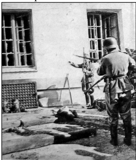
Выход из подвалов

Уговоры и ультиматумы по рупорам со стороны немецкого командования также не принесли никакого результата. Солдаты решили держаться до последнего патрона. 26 июня немцы подогнали паровоз с мощным насосом и с огромной силой начали нагнетать воду в подвал. Двое суток затапливалось то, что еще не было затоплено. Солдаты решили выходить. 29 июня в 9-11 часов утра удалось выбраться под навесной перрон. Истощенных и обросших военных немцы отделили от остальных и отправили в лагерь Тереспоя – к пленным из Брестской крепости.