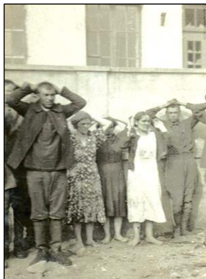
Пленные защитники вокзала