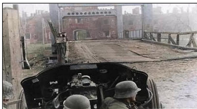
Гитлеровцы на мосту близ Брестской крепости

В книге С. Смирнова «Брестская крепость» в одном из воспоминаний участников обороны говорится, что попытки таких атак имели место быть. Причём проводились они несколько раз. Но, заканчиваясь каждый раз поражением с большими людскими потерями, вскоре идея прорыва была отвергнута.