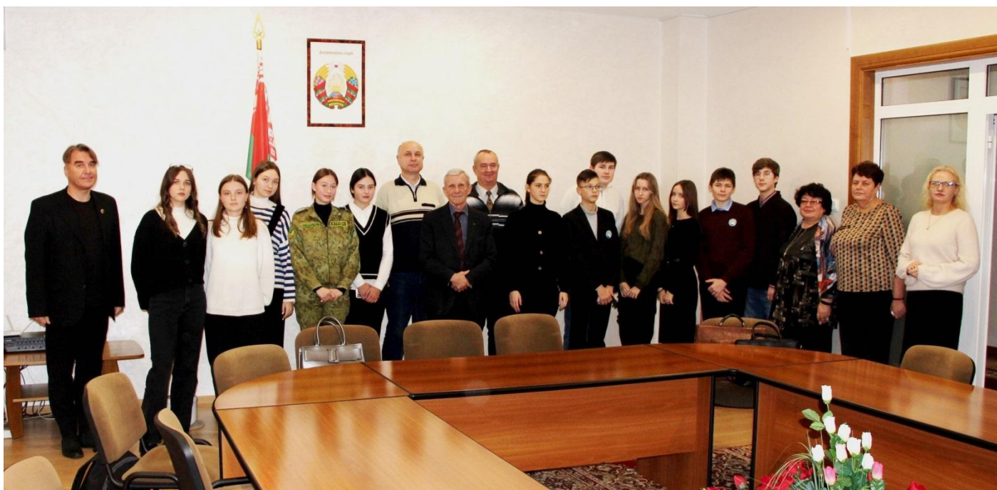
Словодром # 43