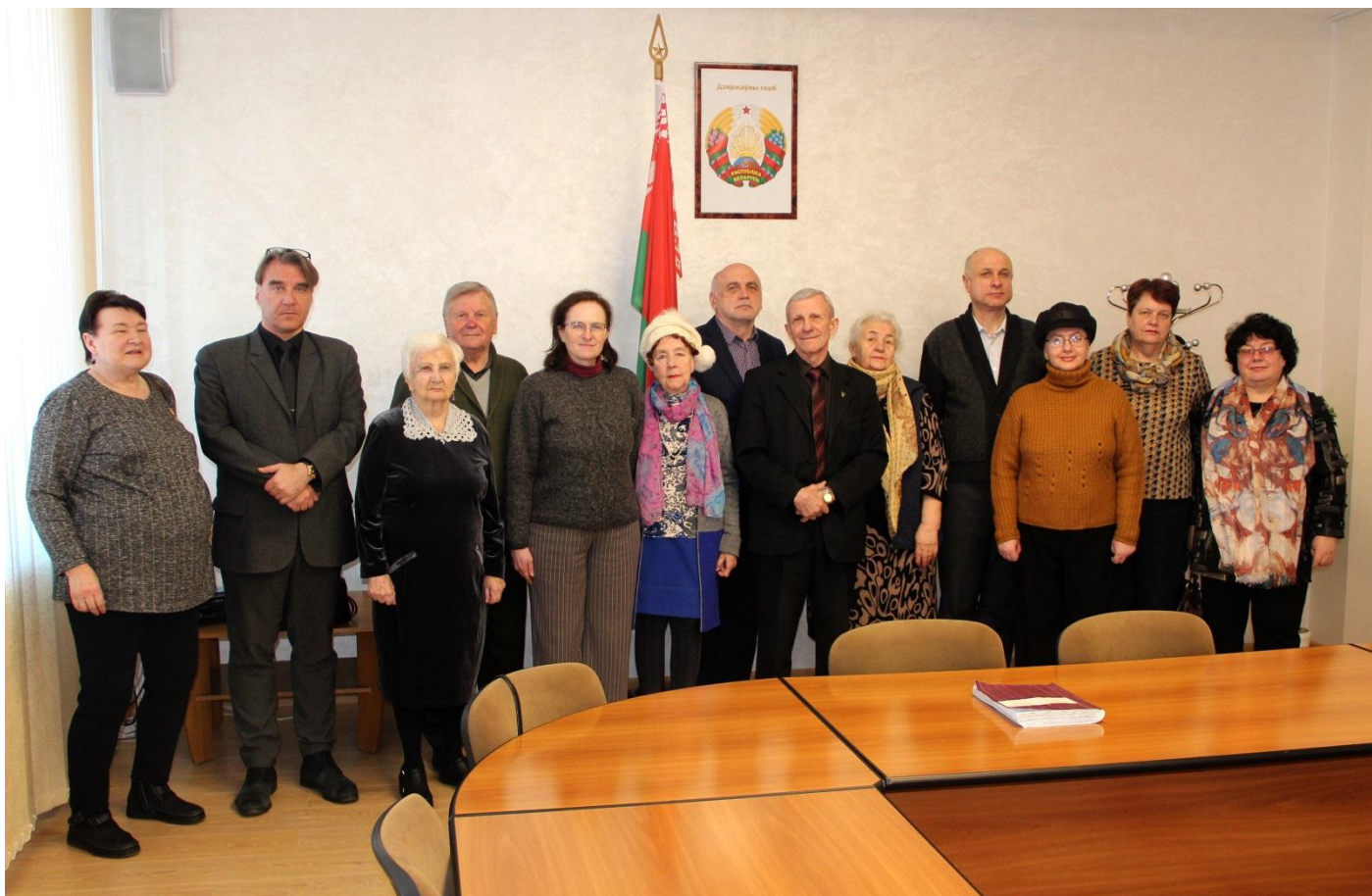
Словодром # 47