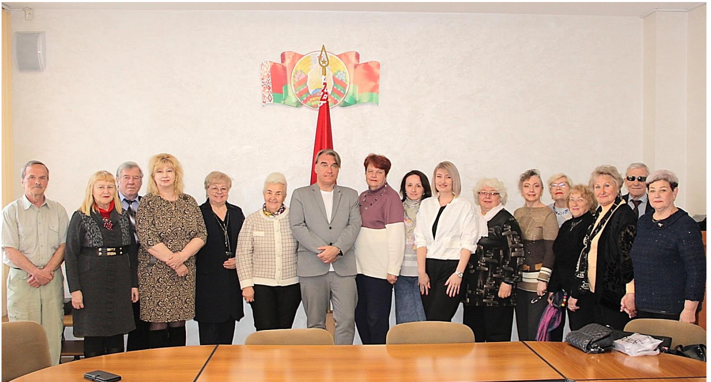
СЛОВОДРОМ # 74